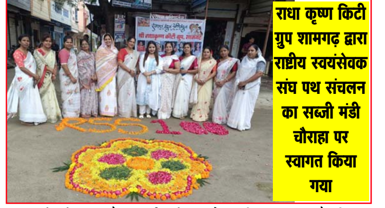
राधा कृष्ण किटी गुपु शामगढ़ द्वारा राष्ट्रीय स्वयंसेवक संघ पथ संचलन का सब्जी मंडी चौराहा पर स्वागत किया गया

राष्ट्रीय स्वयंसेवक संघ की स्थापना वर्ष 1925 में नागपुर में डॉ. हेडगेवार द्वारा की गई थी। इस वर्ष संघ अपने