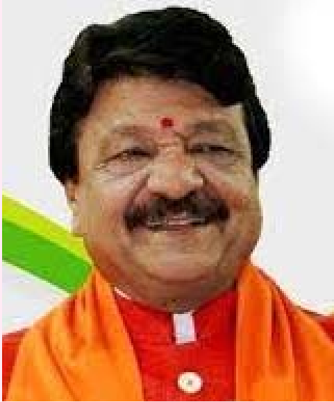
यशस्वी दुनिया ◉ शामगढ़

शामगढ़ । नगर परिषद द्वारा शिव हनुमान मंदिर झंडा चौक पर निर्मित वीर शिरोमणि महाराणा प्रताप जी की भव्य