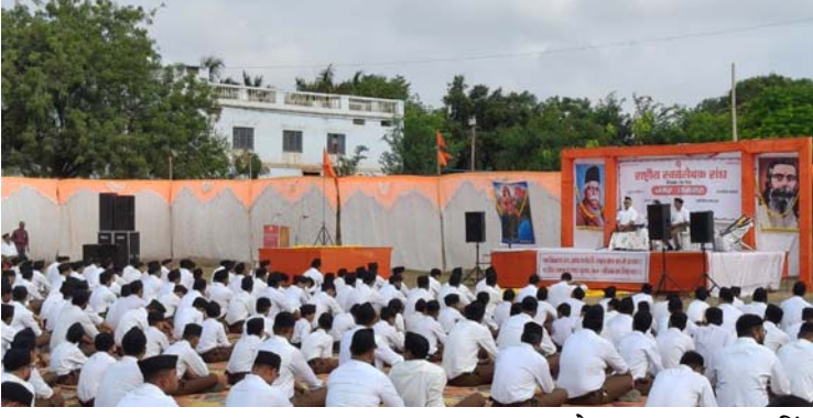
यशस्वी दुनिया ◉ शामगढ़

शामगढ़। विजयादशमी उत्सव के शुभ अवसर पर राष्ट्रीय स्वयंसेवक संघ नगर शामगढ़ द्वारा संघ के शताब्दी वर्ष के निमित्त सोमवार को वृहद पथ संचलन का आयोजन किया गया। यह आयोजन राष्ट्रभक्ति, संगठन शक्ति और सामाजिक एकता का जीवंत प्रतीक बनकर नगरवासियों के हृदय में देशभक्ति की नई चेतना का संचार कर गया। कार्यक्रम का एकत्रीकरण मिडिल स्कूल ग्राउंड शामगढ़ में हुआ, जहाँ से संचलन का शुभारंभ भारत माता पूजन एवं शस्त्र पूजन के साथ विधिवत किया गया।